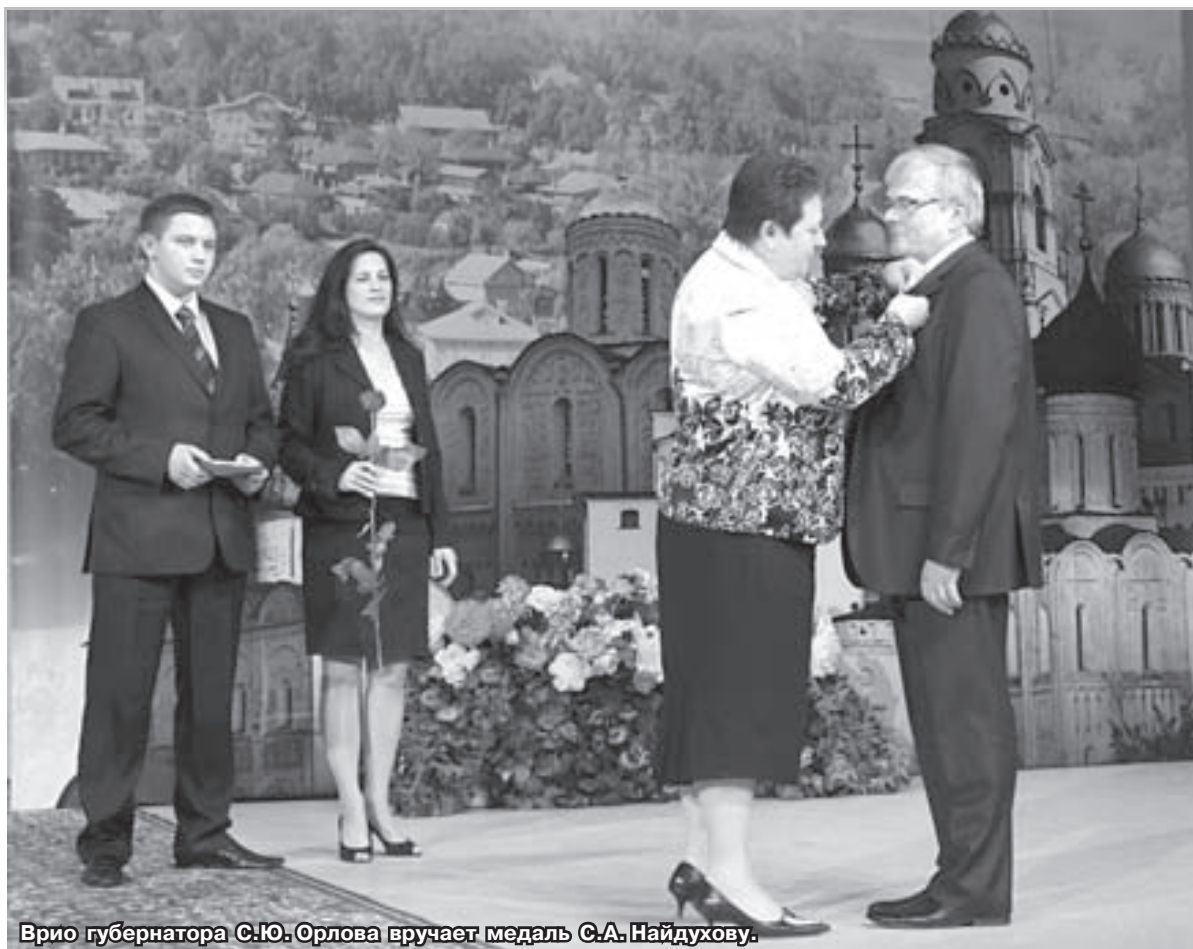
Врио губернатора С.Ю. Орлова вручает медаль С.А. Найдухову.

Весенние субботники ..... стр.2 Экономическое совещание..... стр.3 Начался весенний призыв ..... стр.4 Новости области..... стр.5 В Радужном появится ещё одна газета..... стр.7 Поздравления, объявления, реклама..... стр.8-12